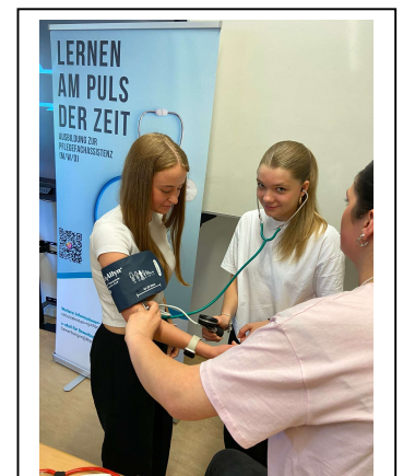
Krankenhaus Porz am Rhein

Viele wurden in ihrem geplanten Berufsziel bestärkt, manche erlangten ganz neue Perspektiven durch das BO-Camp.